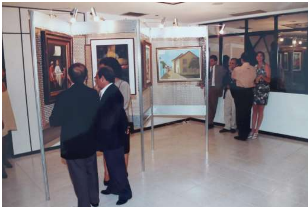
ANTES: antessala do auditório